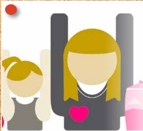
Voel je goed! is een initiatief van Stichting Lezen & Schrijven Voel je goed! wordt gratis aangeboden door Gemeente Hollands Kroon

Deze is op zaterdag 24 september bij Leven van de wind in Wieringerwerf. Het is een dag met veel informatie over duurzaamheid, gericht op de inwoners van Hollands Kroon. Met demonstraties, activiteiten, workshops, etc. Van energiebesparing tot duurzame energie, elektrisch rijden, kringloop, biodiversiteit en klimaatadaptatie.