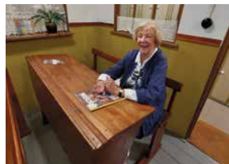
Het oudste schoolbankje dat is gevonden