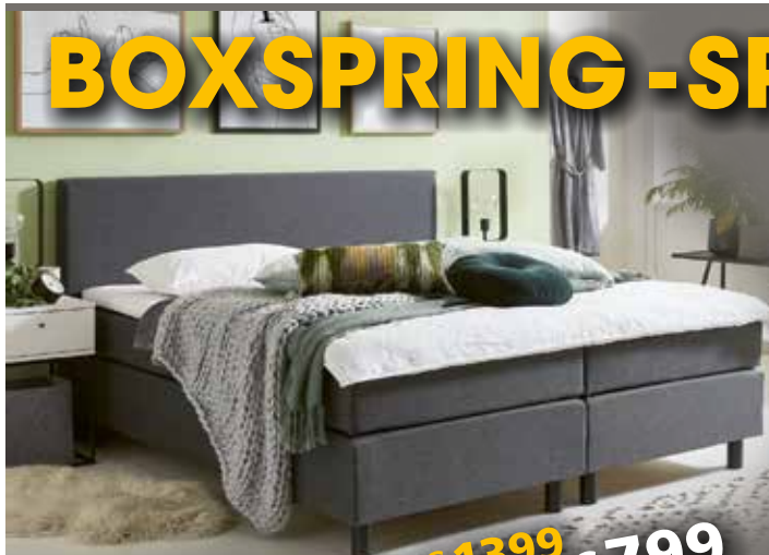
Boxspring V620 incl. topper