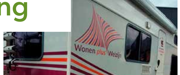
Mobiele Ontmoetingsplek in een nieuw jasje