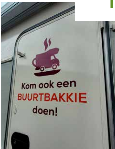
Als dit geen uitnodiging is!