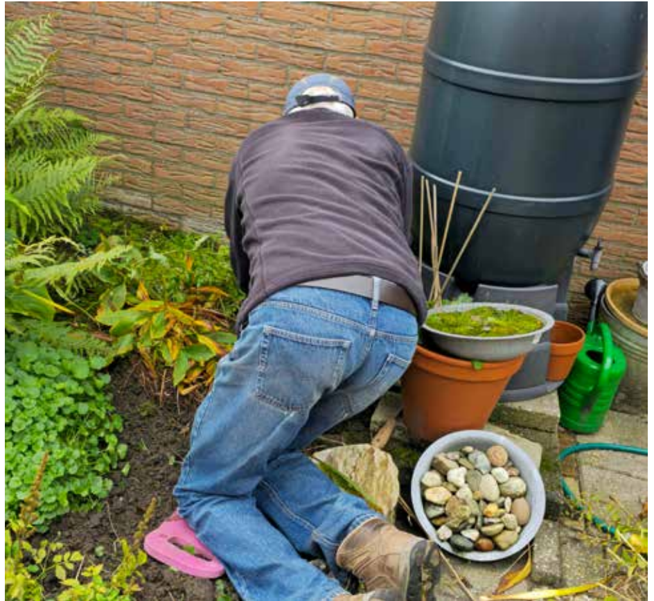
Een van de vrijwilligers in actie tijdens tuindagen

De woensdag daaropvolgend vulden wij de dag met een tweede ronde van tuinwerkzaamheden. Van 10.00 tot 13.00 uur gingen we met vier vrijwilligers en één beroepskracht aan de slag in vier tuinen. Wederom twee nieuwe gezichten die zich tijdens speciale tuindagen graag inzetten. De inzet van de vrijwilligers was opnieuw indrukwekkend en de tuinen kregen de