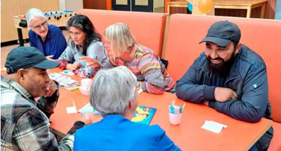
Een groep in gesprek