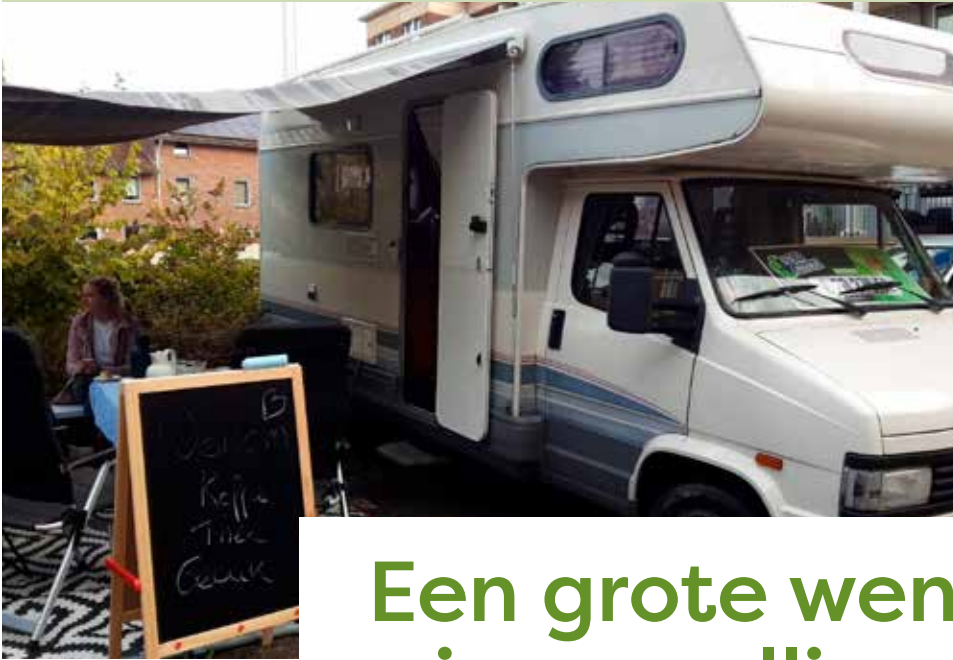
Mobiele Ontmoetingsplek buurtbijeenkomst