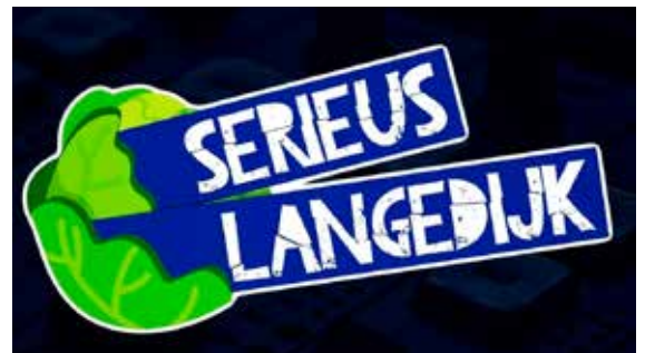
Waar een klein dorp groot in kan zijn

E en jaar geleden waren wij het goede doel van de radiomarathon Serieus Langedijk. Een enthousiast team vrijwilligers zamelt met deze actie jaarlijks geld in voor een lokale organisatie. De laatste week van elk jaar, vanaf 27 december tot en met 31 december (jaarwisseling), 24 uur per dag. Belangstellenden kunnen plaatjes aanvragen, meedoen aan veilingen en leuke acties. Het was een onvergetelijke week met een eindopbrengst van maar liefst € 20.270,52! Het overweldigt ons nog steeds dat de initiatiefnemers en alle donateurs en sponsors ons zo'n warm hart toedragen. Bedankt!