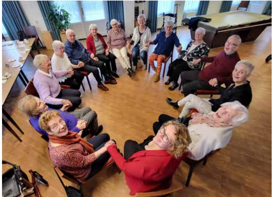
Samen poseren voor het magazine

Spreekt het u aan om de dag te starten met een vertrouwd belletje? Of weet u het niet zeker, maar wilt u deelname best proberen? Het kan allemaal. Voor meer informatie, neem contact met ons op via tel. 072-5717170 of e-mail: dijkenwaard@wonenpluswelzijn.nl .